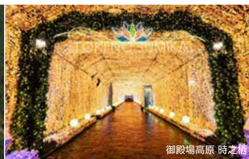
御殿場高原 時之栖